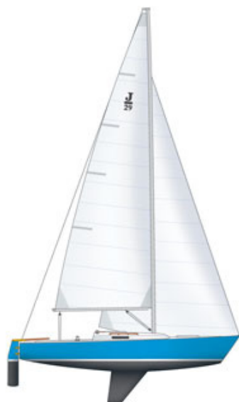
Fiche technique - J/29