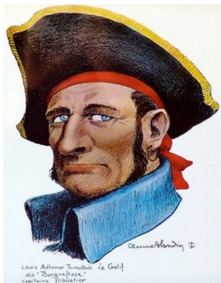
Louis Adhémar Timothée Le Golif

Autour d'un verre, les récits et les découvertes se discutent avec passion. Et le livre d'Adhémar devient un peu, de par ses nombreuses aventures autant corsaires que galantes, une source de joyeuses discussions. La chanson des tribordais est de cette veine là !