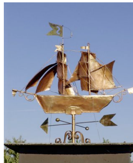
Bon vent le Canard !

Surmonté d'une girouette, il indique aujourd'hui d'où vient le vent à tout le quartier !