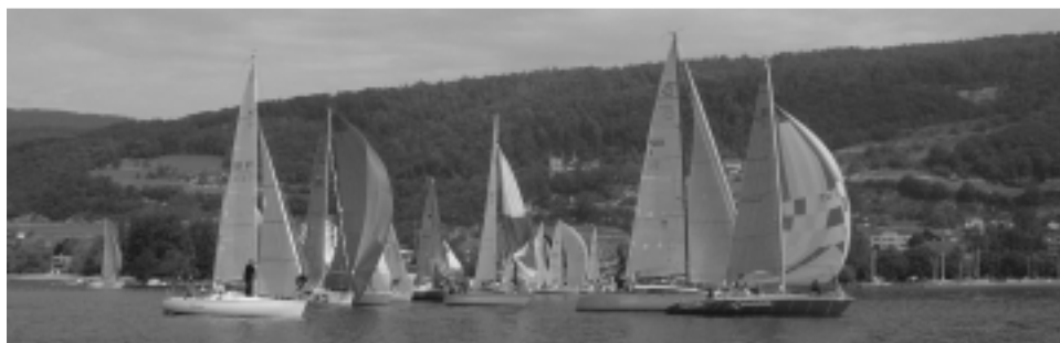
le départ du Bol d'Or

Manquent les rangs 11 à 22, tous DNF. Résultats complets sur le site Internet de la BT.