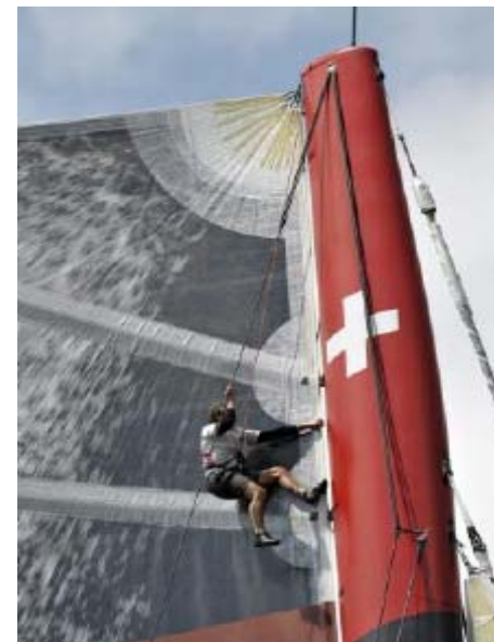
Les 5 derniers mètres du mât d'Alinghi !

Le mât lui-même présente une largeur à la base qui cache sans autre 3 solides marins en train de préparer une manœuvre !