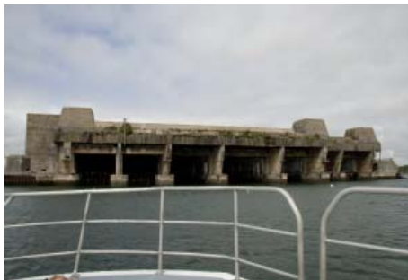
La base de sous-marins de Keroman

Juste à côté, la base de sous-marins de Keroman ( http://www.uboat-bases.com/fr/lorient.php ) bâtie par les Allemands entre 1941 et 1943 se visite, mais il faut absolument réserver, les groupes sont petits et il y a peu de visites. Cette base abritait 40 sous-marins et 1000 hommes. A cause d'elle, Lorient fut détruite par les Alliés en 1943.