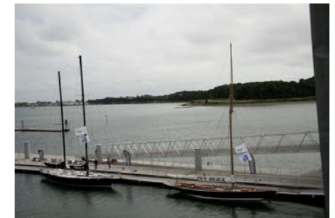
Les Pen-Duick I et III

les petits mais surtout chez leurs papas... Lors de notre visite, les Pen Duick I et III étaient à quai, leur présence variant en fonction de leurs engagements en régate ou autre course-croisière.