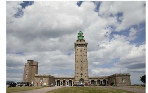
Le phare de Cap-Fréhel

Des falaises de 70 mètres, des mûres, des landes de bruyère et de chèvrefeuille forment un paysage spectaculaire mais resté sauvage grâce aux mesures de sauvegarde.